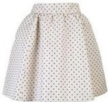
Юбка с завышенной талией