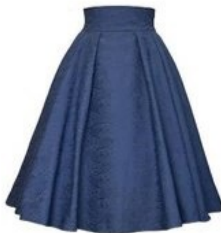
Юбка в стиле 50-х